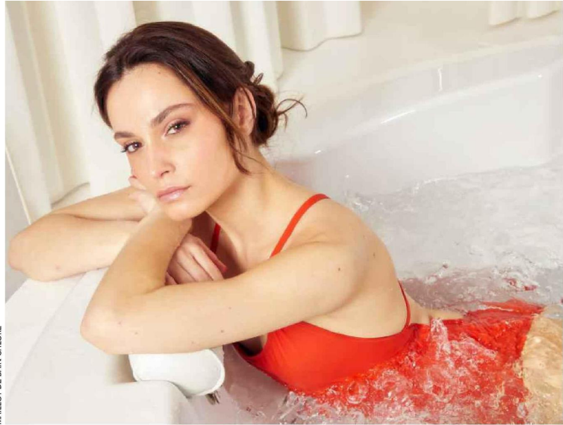
MAILLOT DE BAIN CHLORE